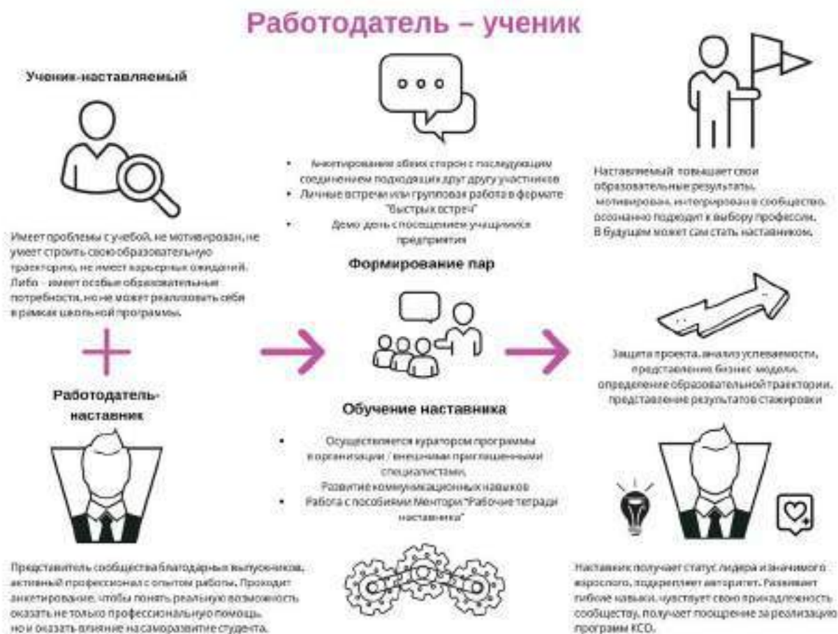
Рисунок 4. Графическое представление наставнического взаимодействия по форме «работодатель – ученик»