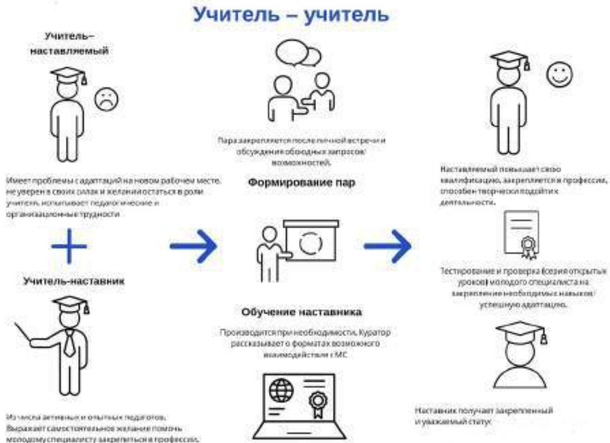
Рисунок 2. Графическое представление взаимодействия по форме «учитель – учитель»