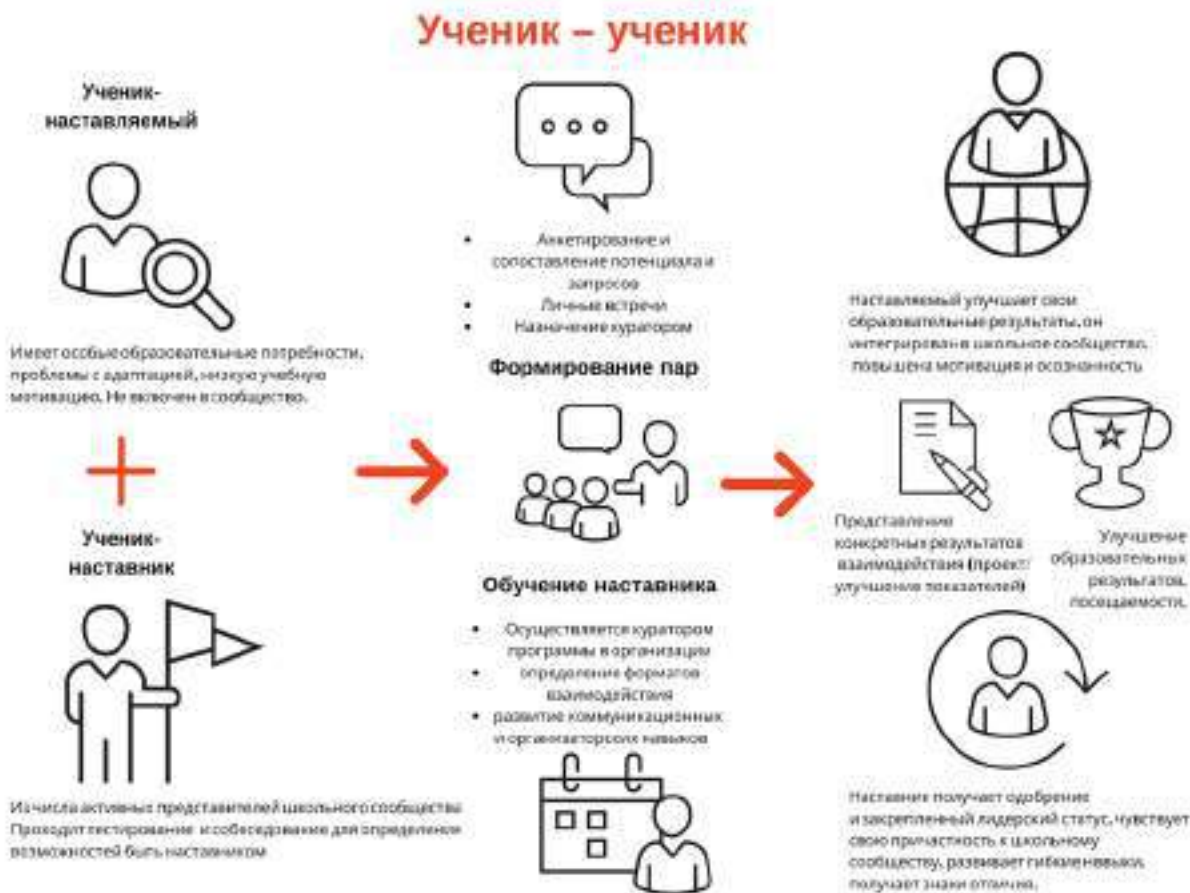
Рисунок 1. Графическое представление взаимодействия по форме «ученик – ученик»