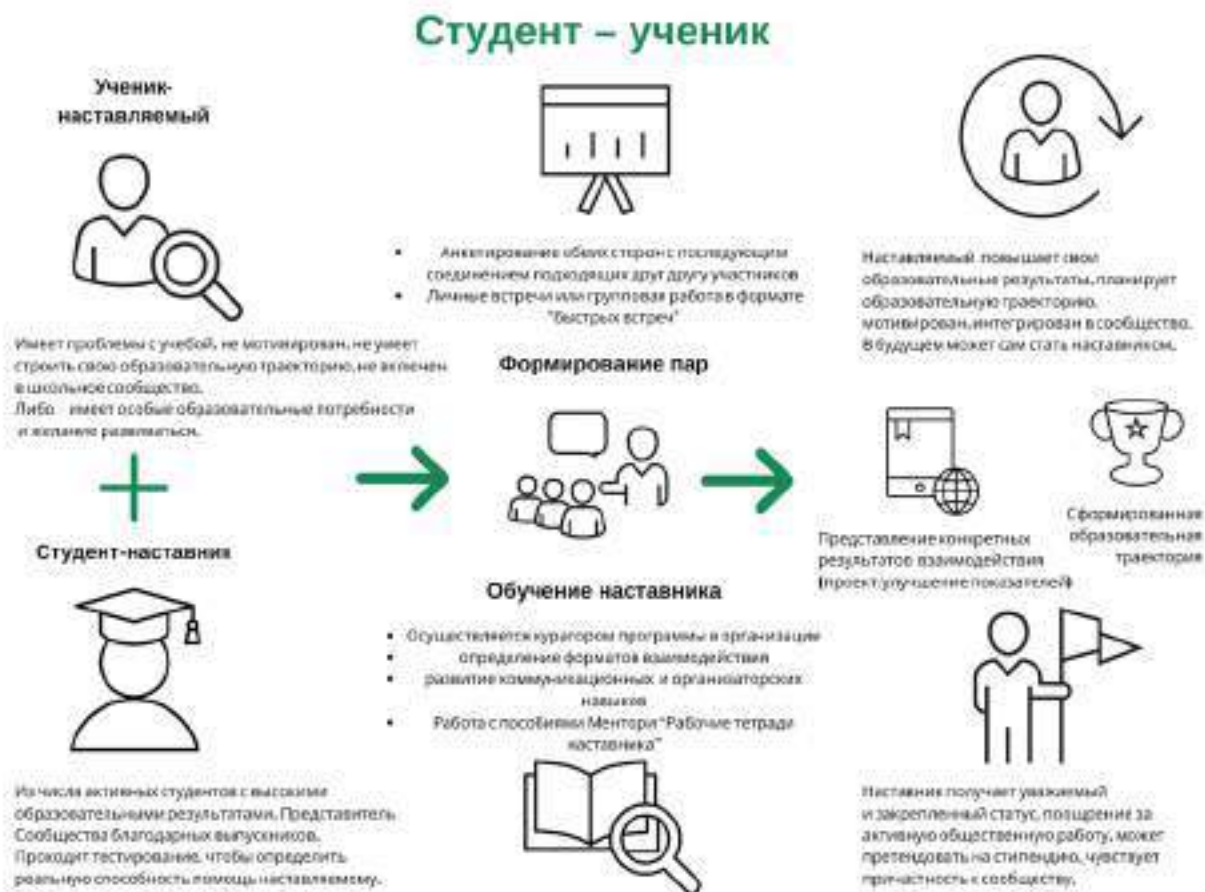
Рисунок 3. Графическое представление наставнического взаимодействия по форме «студент – ученик»