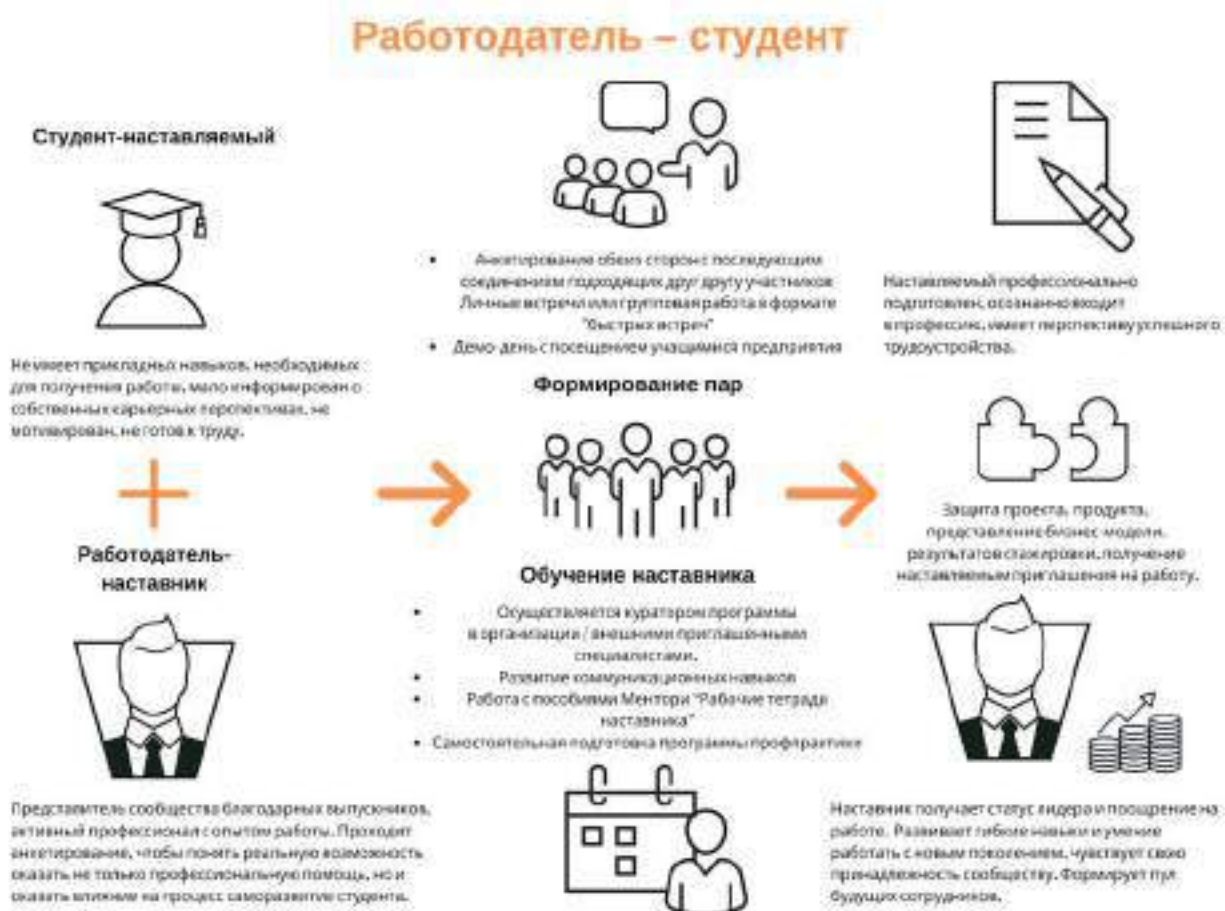
Рисунок 5. Графическое представление наставнического взаимодействия по форме «работодатель – студент»